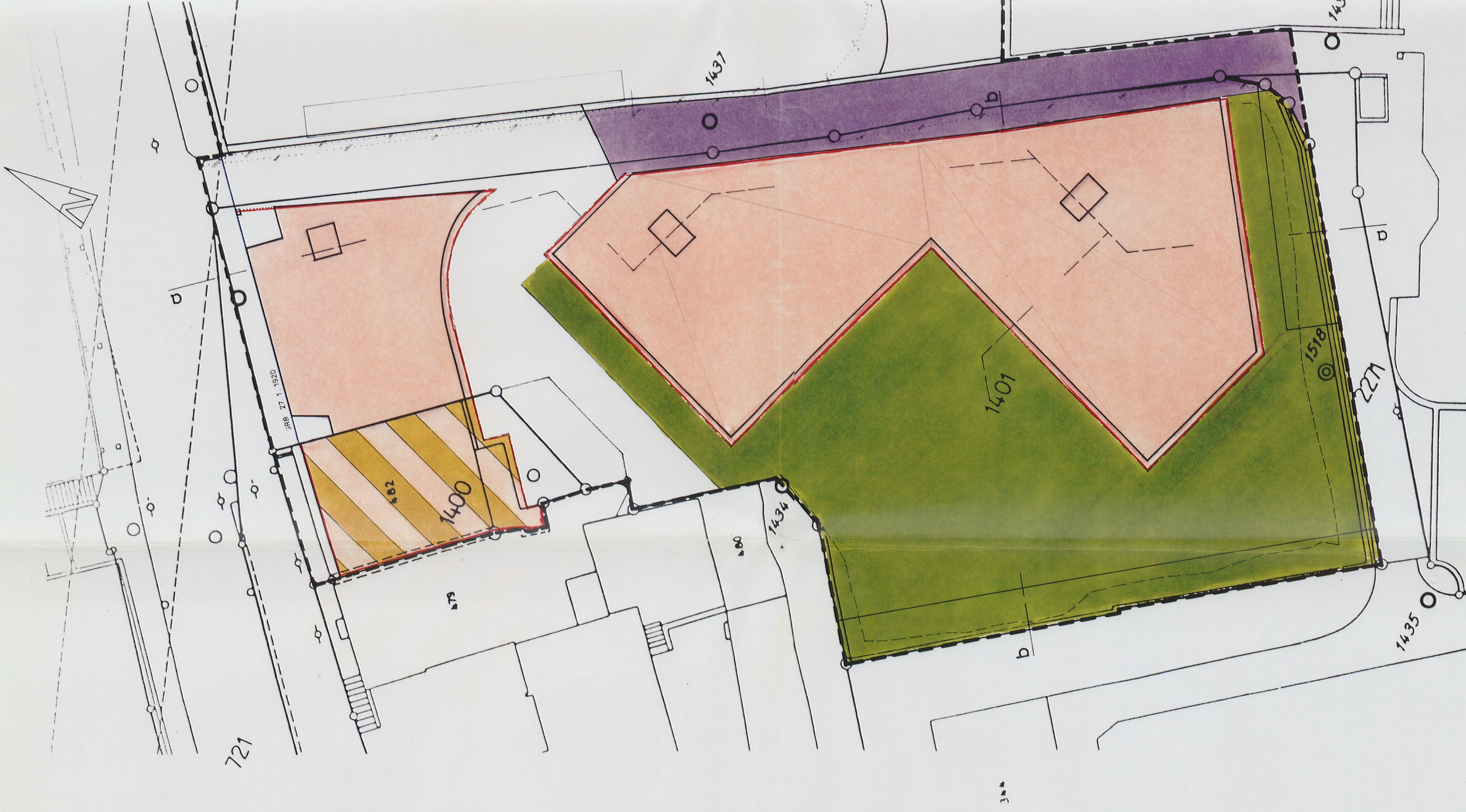
Nutzungsplan Niveau 2 + 5.40 Gewerbe

Legende Orientierungsinhalt vom Grossen Rat genehmigte Bauline GRB 27.1.1920