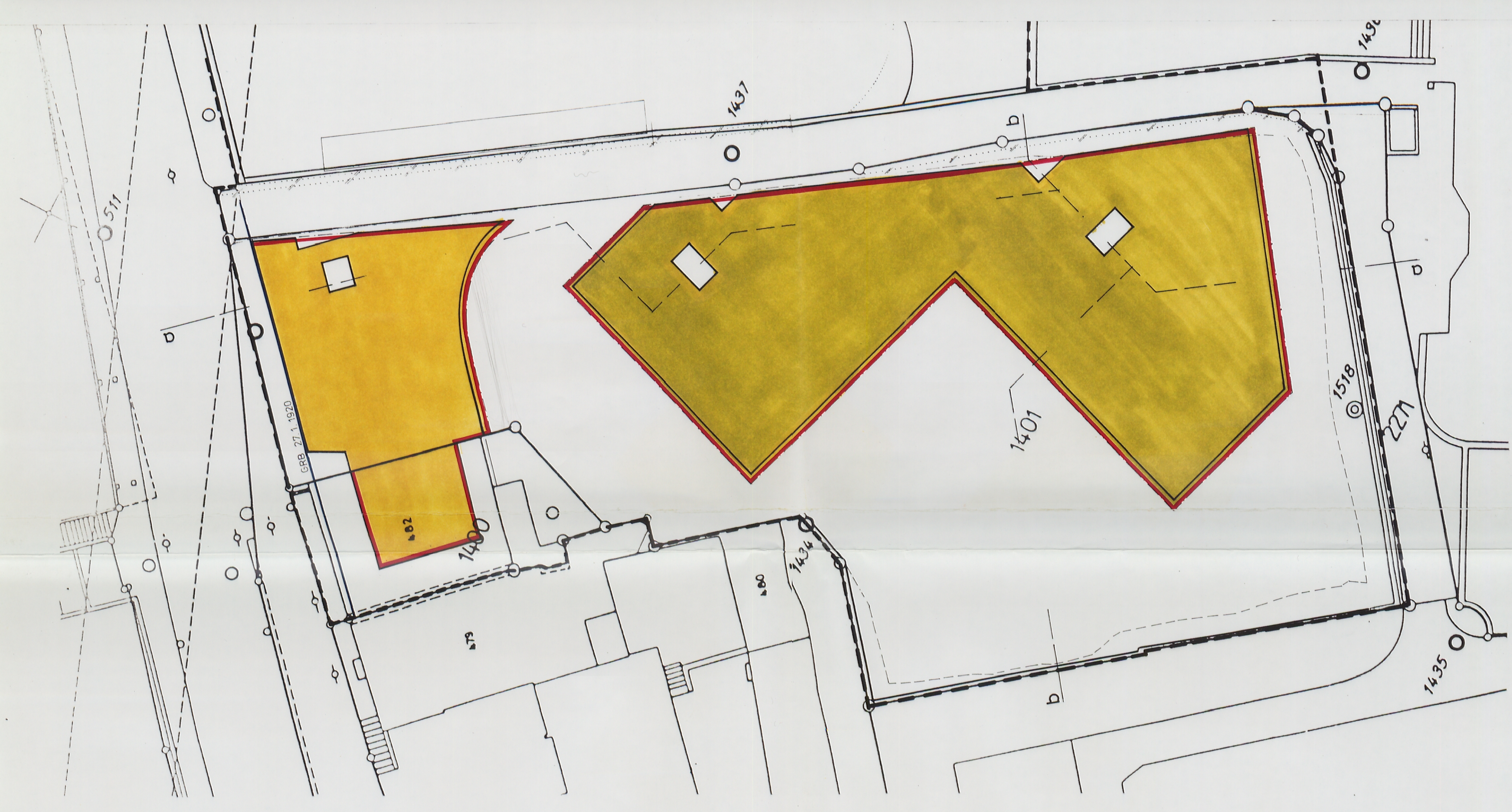
Nutzungsplan Niveau 4 +10.90 Wohnen