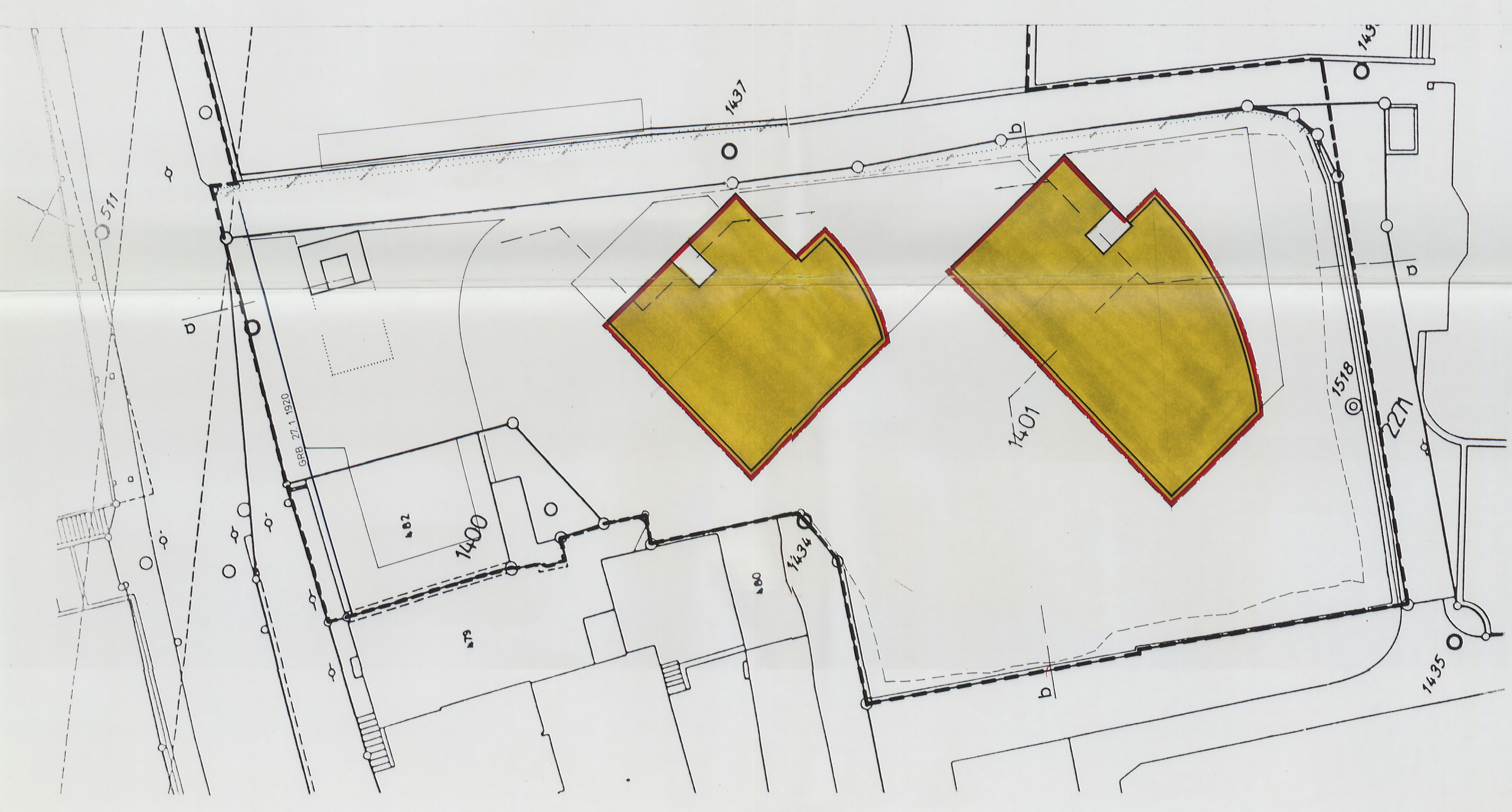
Nutzungsplan Niveau 5 +13.60 Wohnen